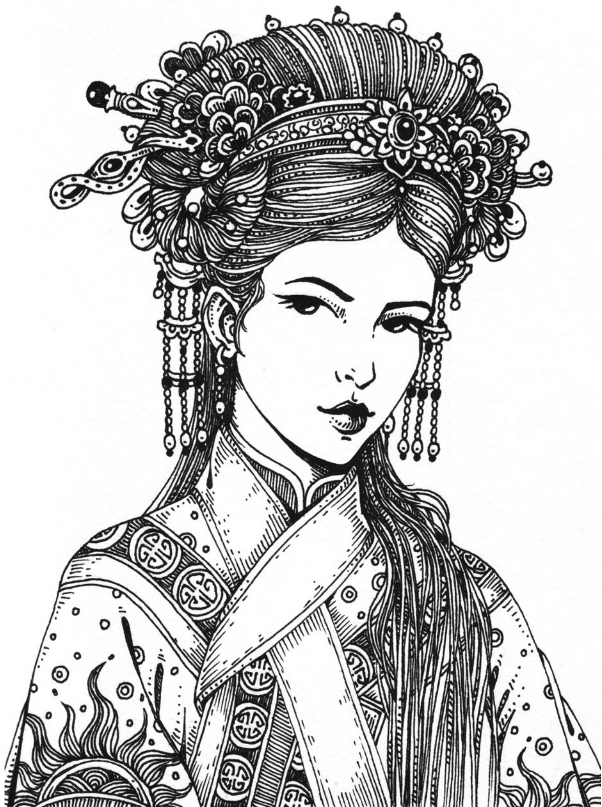
LA PRINCESSE LIAHAO